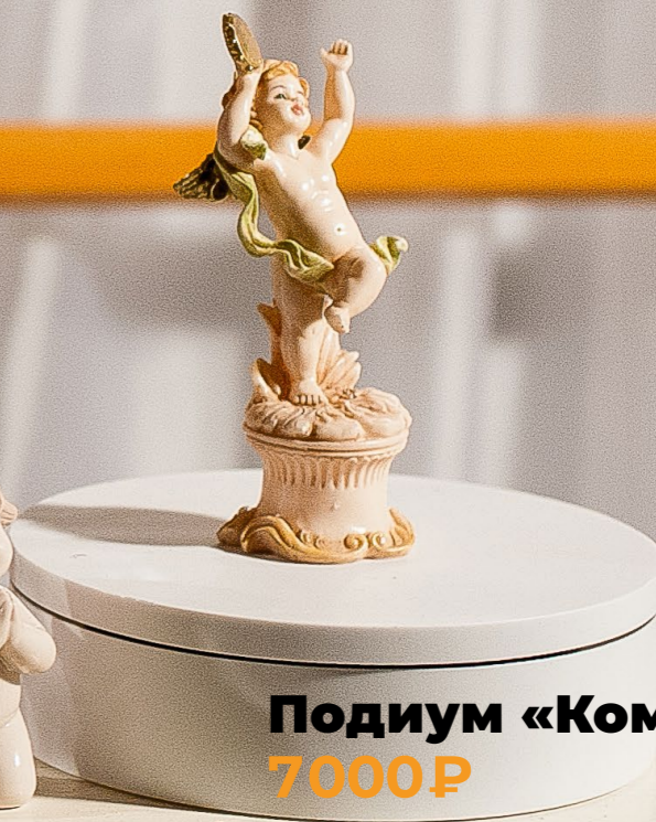
Подиум «Компакт» 7000₽