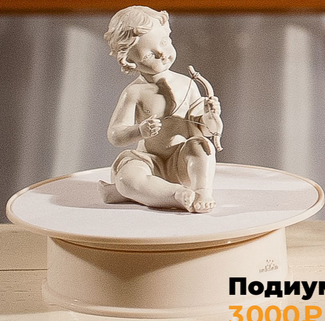
Подиум «Твист» 3000₽