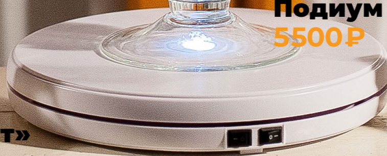
Подиум «Лайт» 5500₽